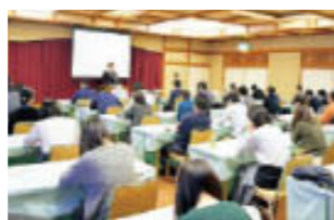
温泉ソムリエ講座

自己啓発を支援する休日自主参加研修です。銀行業務に関する専門知識のほか、コミュニケーション能力を高める講座や地域産業史を学ぶ講座など多種多様な研修が用意され、毎年多くの職員が参加しています。