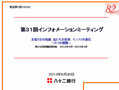
【機関投資家・アナリスト向け会社説明会】