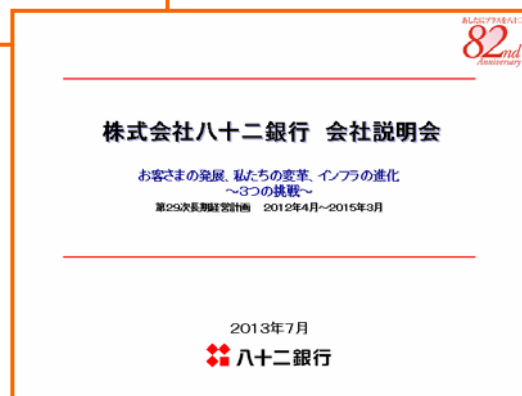
【個人投資家向け会社説明会】