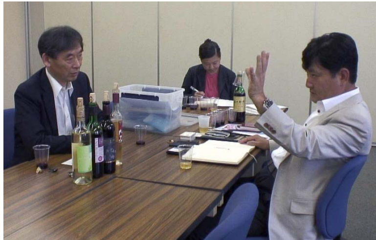
「海外バイヤー招聘『食』の個別商談会 in 長野」の光景 (18件の商談を実施)

販路開拓や地域産業の活性化のため、各種商談会を国内外で企画・開催し、ビジネスマッチングの場を提供しております。また、お客さまのビジネスに役立つ情報をタイムリーに発信する各種セミナー・相談会を開催しております。