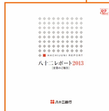
【ミニディスクロージャー誌】