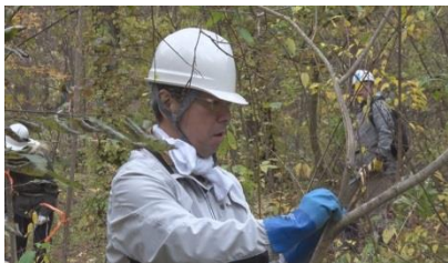
「八十二の森」活動の様子

⇒ 日本経済新聞社が発表した第21回(平成29年度)「環境経営度調査」の企業ランキングで、4年連続地方銀行界1位(銀行界では2位)となりました。